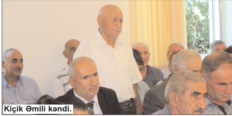
Kiçik Əmili kəndi.

Həmçinin respublikamızın başqa bölgələrində də xalqın rifah halının daha da yaxşılaşdırılması,