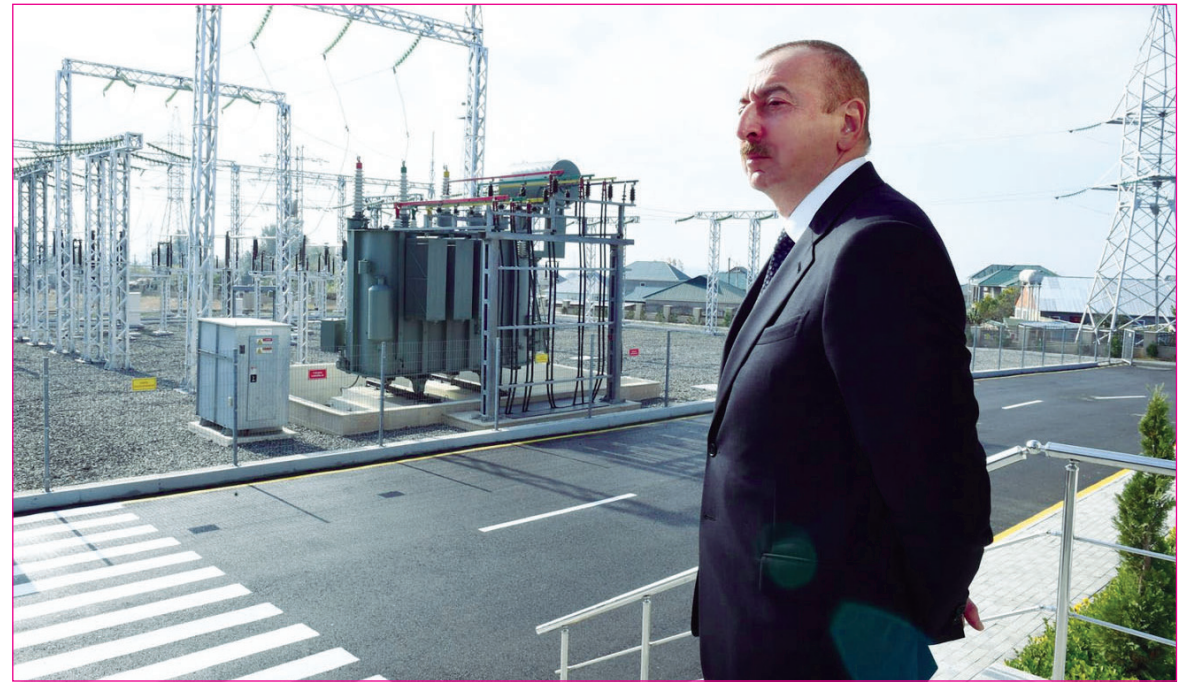
Prezident İlham Əliyev Qəbələ elektrik yarımstansiyasında yenidənqurmadan sonra yaradılan şəraitlə tanış olub.

peşə kursuna cəlb olunmuşdur. Eyni zamanda 15 nəfər mehmanxanada 3 aylıq təsərrüfat işləri