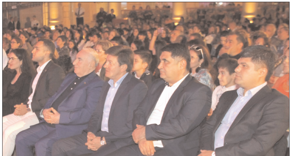
Qəbələ VIII Beynəlxalq Musiqi Festivalı.