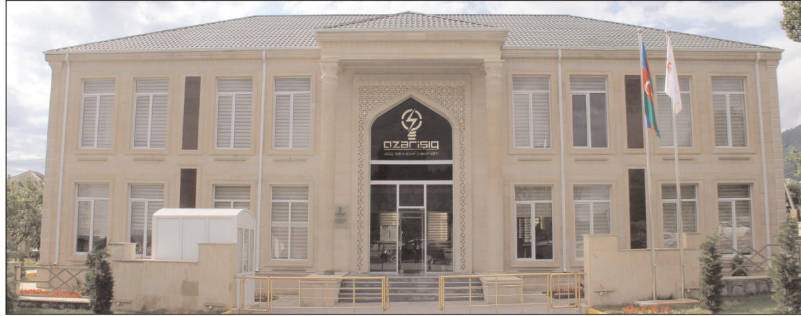
Azərişiq Şimal-qərb Regional Elektrik Təchizatı və Satışı İdarəsinin yeni binası.

mişdir. Suvarma sistemləri idarəsi tərəfindən 16.805 manat su pulu yığılaraq illik pla-