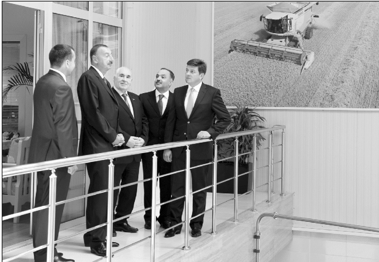
(Əvvəli 4-cü səhifədə).

«Aqro Kompleks Qəbələ» MMC-nin aqrar-sənaye kompleksi istifadəyə verilmişdir