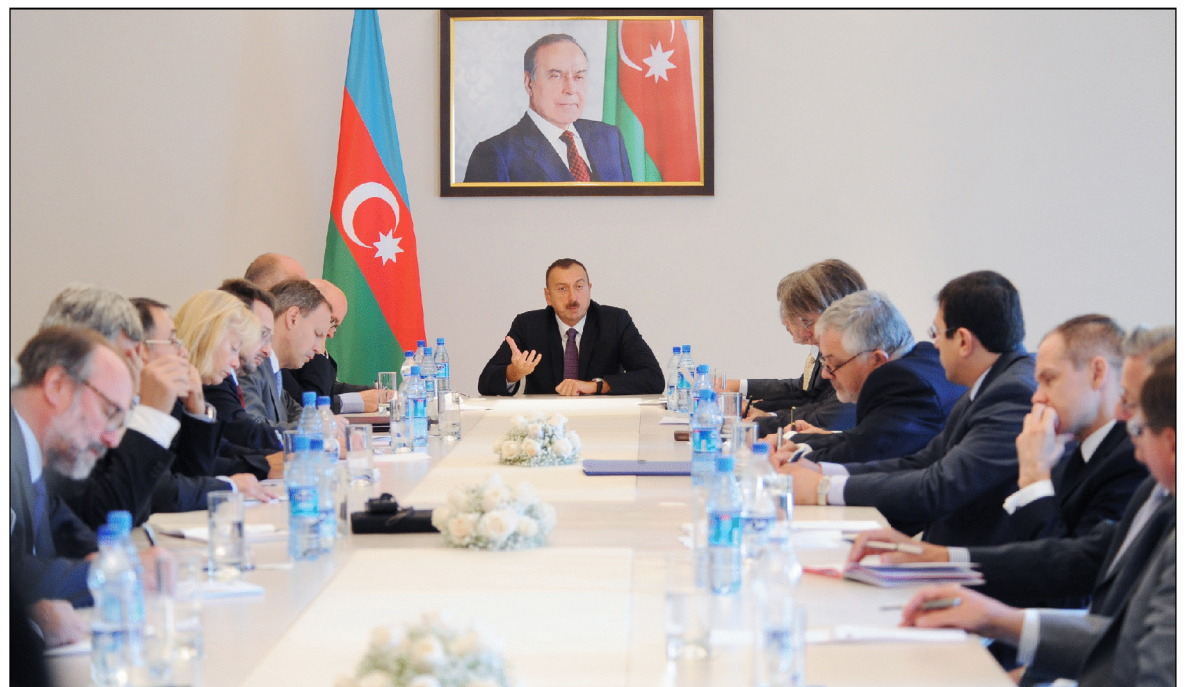
Azərbaycan Prezidenti İlham Əliyev 2012-ci il sentyabr ayının 11-də ATƏT-ə üzv ölkələrin səfirlərini qəbul etmişdir.

İki dost və qardaş ölkələrin liderləri, Azərbaycan Respublikasının Prezidenti cənab İlham Əliyev və Türkiyənin Baş naziri cənab Rəcəb Tayyib Ərdoğan tədbirdə bəyanatlarla çıxış etmişlər.